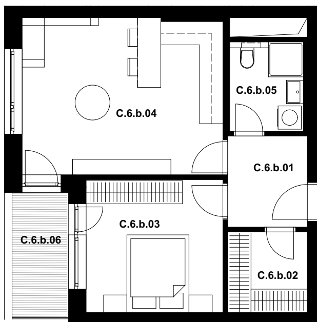
POLOHA JEDNOTKY V RÁMCI PODLAŽÍ