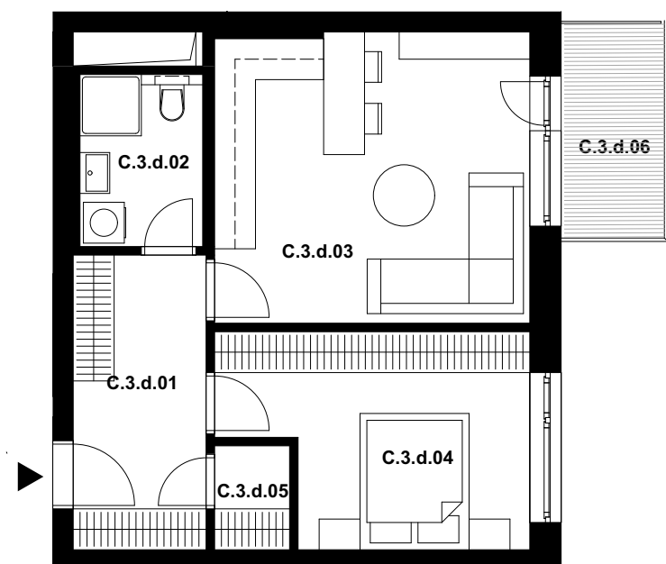
POLOHA JEDNOTKY V RÁMCI PODLAŽÍ